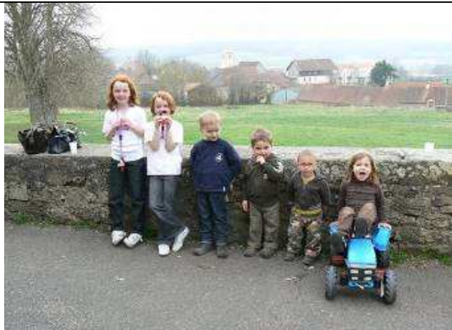
La relève JCI !