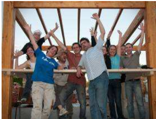
Le stand Macon après le vernis !