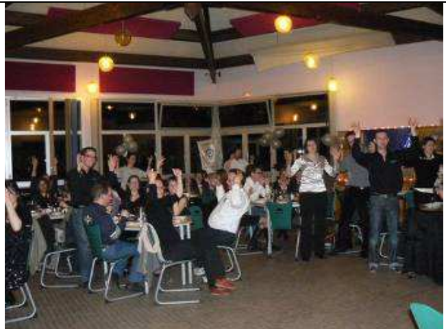
Traditionnel ban bourguignon pour l'équipe organisatrice des JRF !