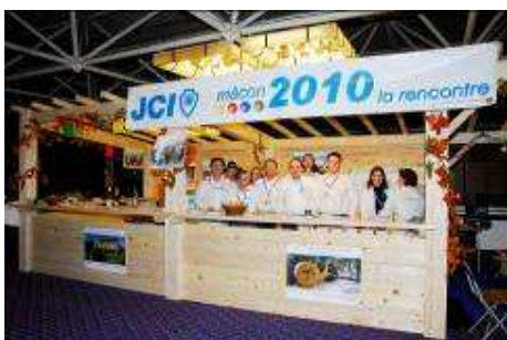
Le stand Macon à Nice avant le vernis !